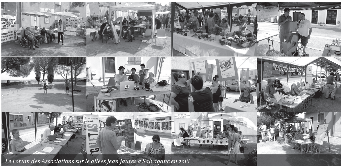
Le Forum des Associations sur le allées Jean Jaurès à Salvagnac en 2016