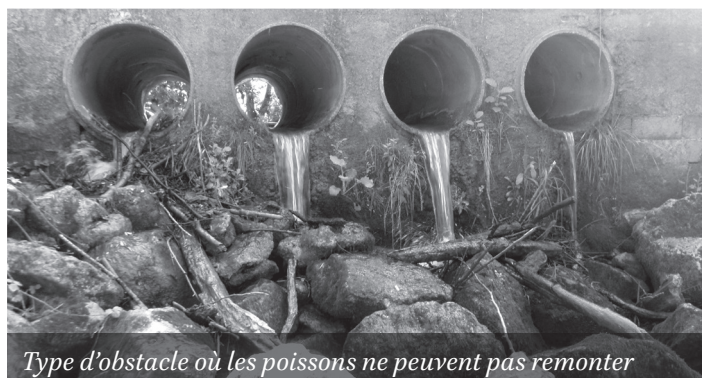
Type d'obstacle où les poissons ne peuvent pas remonter

Toutes les installations, ouvrages et travaux en cours d'eau doivent faire l'objet, à minima d'une déclaration écrite à la Direction Départementale des Territoires. Il est formellement interdit d'intervenir dans un cours d'eau, vidanger un plan d'eau, faire entrer un engin dans une rivière pour des