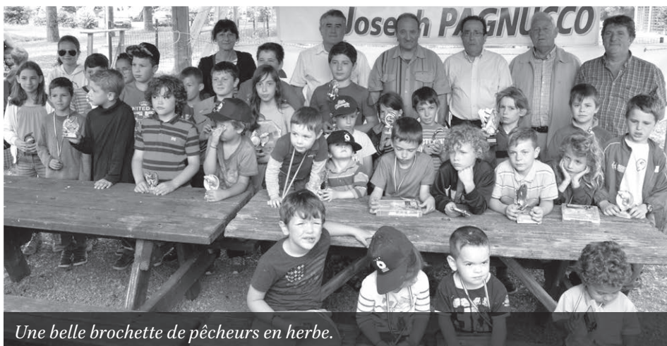
Une belle brochette de pêcheurs en herbe.