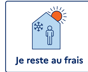
Je reste au frais