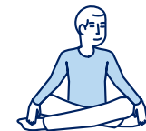
Je fais des activités sans effort