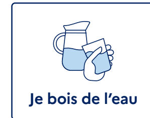
Je bois de l'eau