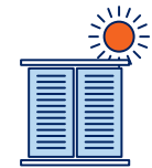
Je ferme les volets et fenêtres le jour, j'aère la nuit