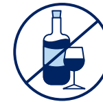
J'évite de boire de l'alcool