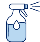
Je mouille mon corps